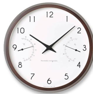
PC17-05 BW ブラウン 4515030075967