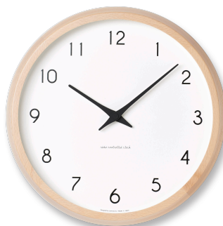
PC10-24W NT ナチュラル 4515030073857