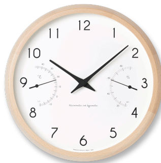
PC17-05 NT ナチュラル 4515030075950