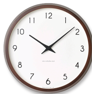
PC10-24W BW ブラウン 4515030073864

タカタレムノスについて：レムノスは1988年「GANBARA (デザイン：川崎和男)」から現代までデザインオリエントな製品を作り続けています。レムノスのデザインは世界で高く評価されています。