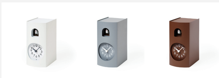
GF17-04 WH ホワイト 4515030075790

GF17-04 寸法:w89×h182×d128mm 重量:1,100g 素材:スチール、MDF、ランバーコア合板 仕様:カコロー時計 音量2段階調整、ライトセンサー機能付 価格:15,000円+税