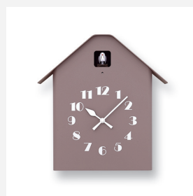
RF17-03 BW ブラウン 4515030075776