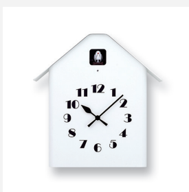
RF17-03 WH ホワイト 4515030075769