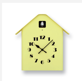
RF17-03 YE イエロー 4515030075783

RF17-03 寸法:w244×h252×d107mm 重量:1,550g 素材:無機質系人造木材、スチール 仕様:カッコー時計 音量2段階調整、ライトセンサー機能付 価格:20,000円+税