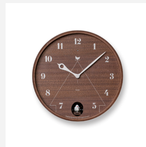
LC17-14 BW ブラウン 4515030075943