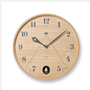
LC11-09 NT ナチュラル 4515030074076

LC17-14 寸法：φ254×d105mm 重量：NT/ 1,130g BW/ 1,200g 素材：NT/ プライウッド BW/ プライウッド、ウォールナット突き板MDF 仕様：カックコー時計、音量2段階調整、ライトセンサー機能付 価格：20,000円+税