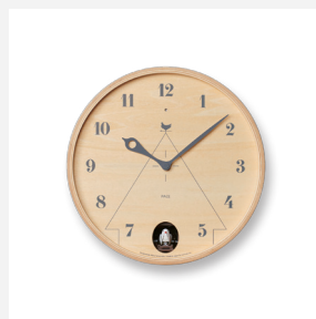
LC17-14 NT ナチュラル 4515030075936