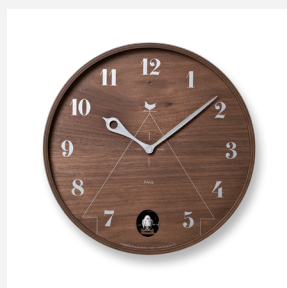
LC11-09 BW ブラウン 4515030074083