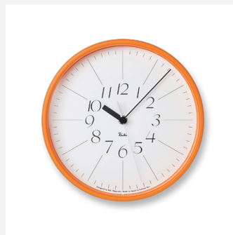
WR17-11 OR オレンジ 4515030075882