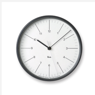
WR17-10 WH ホワイト 4515030075868