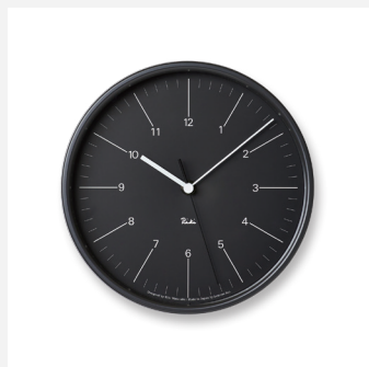
WR17-10 BK ブラック 4515030075875

寸法：φ204×d60mm 重量：610g 素材：スチール、ABS樹脂、ガラス 仕様：スイープセコンド 価格：12,000円+税