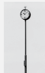
&lt;1979年 パブリッククロック&gt;

公園や駅前などで見かけるパブリッククロック。使われている文字盤デザインの多くが渡辺力の仕事であることはあまり知られていません。1970年代より、精力的に空港、ホテルの世界時計やポール時計等、モニュメンタルな公共時計を第一線でデザインしてきたそのエッセンスが凝縮されています。親しみやすさを重視したアラビア数字タイプから環境に合わせて使える力強い記号的な表現のものまで、既にアノニマスな名作と言えるでしょう。今回、その中から3タイプをホームユースに合わせたサイズで展開いたします。