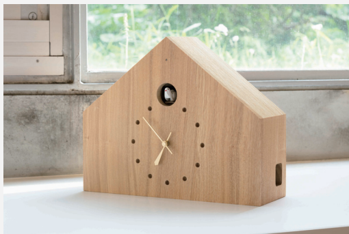
MAA18-01 NT/ナチュラル 4515030076001

寸法:w315×h252×d111 重量:1,600g 素材:タモ材 木枠オスモカラー仕上げ (NT:クリア、GY:小石色) 仕様:カッコー時計 音量2段階調整、ライトセンサー機能付 価格:30,000円+税 JAN: NT 4515030076001 / GY 4515030076018