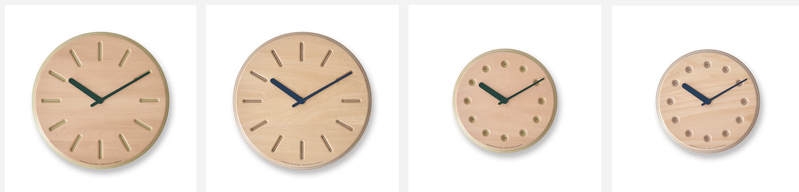
DRL19-06 GN グリーン 4515030076421

サイズ: φ220×d38mm 重量: 320g 素材: Paper-Wood 価格: ¥8,000+税