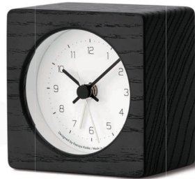
KK24-09 BK ブラック 4515030101970