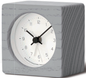
KK24-09 GY グレー 4515030101987

NEW ! KK24-09 w70×h70×d47mm 130g ホワイトアッシュ、ABS樹脂、ガラス 電子音アラーム時計（4段階 小→大）、アラームオートストップ機能（約5分後に自動停止） スリープセコンド ¥8,250 (本体価格:¥7,500)