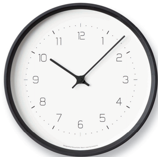
KK22-09 BK ブラック 4515030100836