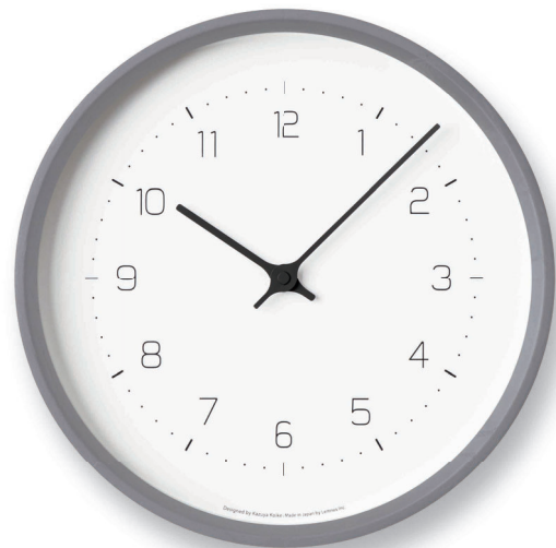
KK22-09 GY グレー 4515030101321