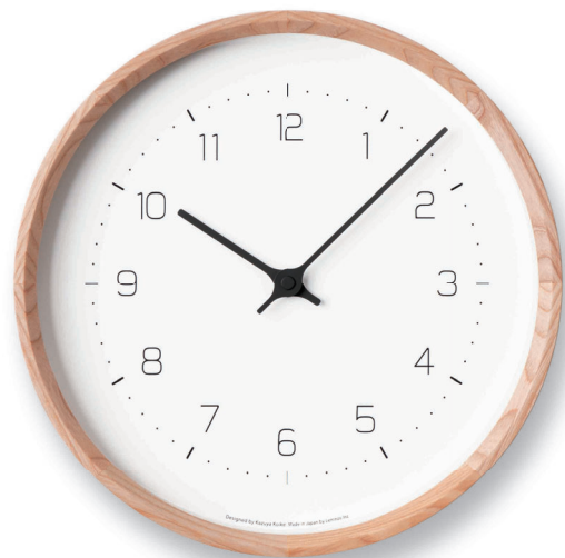
KK22-09 NT ナチュラル 4515030100829

KK22-09 φ288×d50mm 840g ホワイトアッシュ、ガラス ¥19,800 (本体価格:¥18,000)