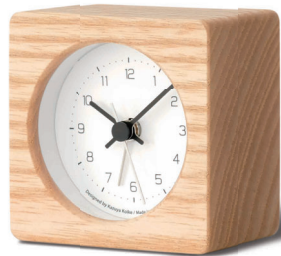
KK24-09 NT ナチュラル 4515030101963