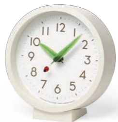
SUR20-06 TENTO てんとう虫 4515030000181

SUR 20-06 w150×h161×d62mm 310g ABS樹脂、ガラス スタンド付属 ¥5,500 (税抜価格¥5,000)