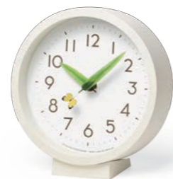
SUR20-06 MONKI モンキチョウ 4515030000174