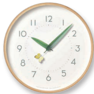
SUR18-16 MONKI モンキチョウ 4515030076339