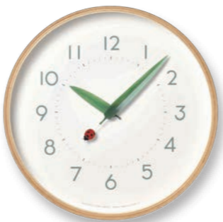
SUR18-16 TENTO てんとう虫 4515030076346

SUR 18-16 φ254×d50mm 585g プライウッド、ガラス ¥8,800 (税抜価格¥8,000)