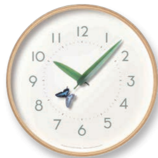
SUR18-16 AGEHA アゲハ蝶 4515030076322