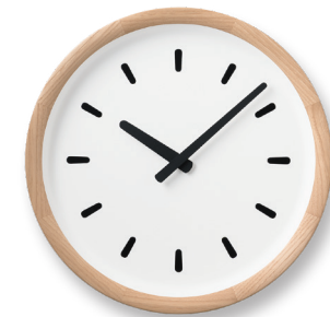
PIL23-05 NT ナチュラル 4515030101062

雫の様な先が窄まったライン指標のデザインです。時間の読みやすさを高めると共に、すっきりとしながらしなやかな印象を与えます。