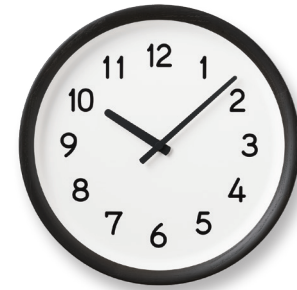
PIL23-04 BK ブラック 4515030101055