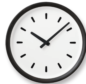
PIL23-05 BK ブラック 4515030101079