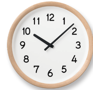
PIL23-04 NT ナチュラル 4515030101048

うつわのような形に馴染む、丸みを帯びたオリジナルフォントのデザインです。時間の読みやすさと親しみやすい雰囲気の両立を目指しました。