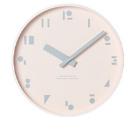
SYO21-04 PK ピンク 4515030100133