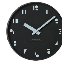
SYO21-04 BK ブラック 4515030100119