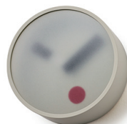
KM 22-01 GY コンクリート 4515030100744