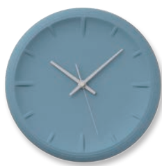
RF 22-06 BL ブルー 4515030100638