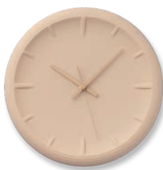
RF 22-06 BG ベージュ 4515030100645