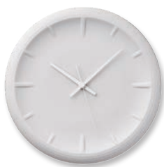
RF 22-06 WH ホワイト 4515030100621