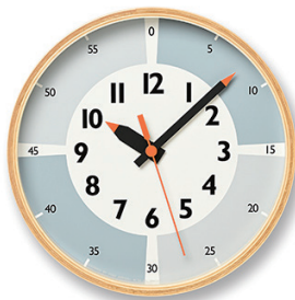
YD 23-09 GY グレー 4515030101413