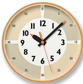
YD 23-09 BG ベージュ 4515030101390