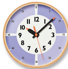
YD 23-09 LI ライラック 4515030101406