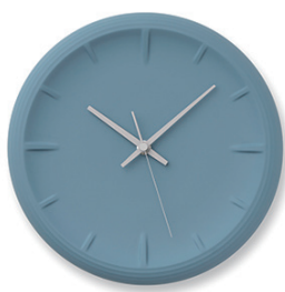
RF22-06 BL ブルー 4515030100638