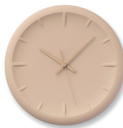
RF22-06 BG ベージュ 4515030100645