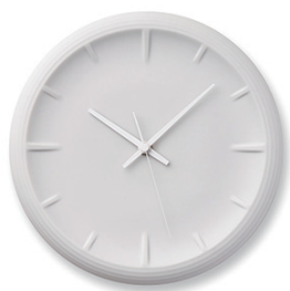
RF22-06 WH ホワイト 4515030100621

RELIEFは、すり鉢状にくぼんだ中央面にレリーフのように指標が浮かび上がり、その彫刻的な美しい陰影により時を知らせる壁掛け時計です。外側のフレーム部分は柔らかな丸みを帯びており、壁に優雅な影を落とします。掛け時計という差別化が難しいジャンルにおいて、基本機能を満たしながら、ミニマルかつ形状に新規性を持たせ新しい時計のかたちを表現しています。天然素材である磁器と、セラミックジャパンによる高度なやきものの技術を用いて歪みのない繊細な形状と陰影を際立たせるマットな質感を実現しました。その外観はモダンなインテリアに調和し、空間の質と時計の価値を高めます。