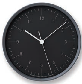
YK23-03 BK ブラック 4515030101093

都会的でシックなクロック。数字も線もシャープに最低限の要素で構成したことで、インテリアの中で主張し過ぎません。ある程度角度がついたところから見ても時間が認識できるようにデザインしています。