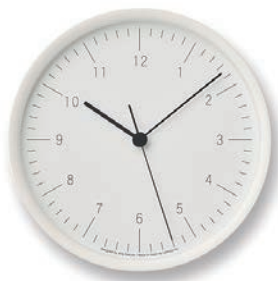
YK23-03 WH ホワイト 4515030101086