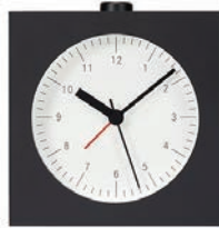
YK22-05 WH ホワイト 4515030100607