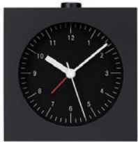
YK22-05 BK ブラック 4515030100614