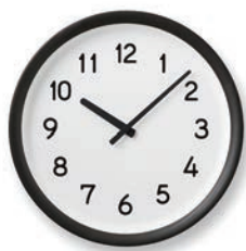
PIL23-04 BK ブラック 4515030101055