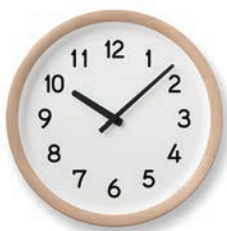
PIL23-04 NT ナチュラル 4515030101048

うつわのような形に馴染む、丸みを帯びたオリジナルフォントのデザインです。時間の読みやすさと親しみやすい雰囲気の両立を目指しました。