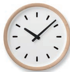
PIL23-05 NT ナチュラル 4515030101062