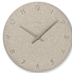
NY 23-06 BG 4515030101437 ベージュ