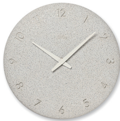
NY 23-06 WH 4515030101420 ホワイト