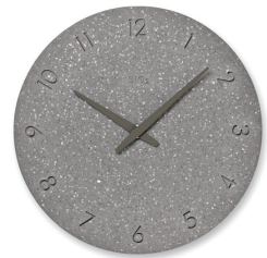
NY 23-06 GY 4515030101444 グレー