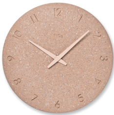
NY 23-06 PK 4515030101451 ピンク

時計というプロダクトを伝統的な素材と技法を用いて過不足なく構築すること、それこそが今回レムノスが目指したことです。カラーバリエーションは珪藻土本来の色を活かしたホワイト（秋田産珪藻土）とピンク（能登産珪藻土）、顔料で色を調色したベージュとグレーの4色です。