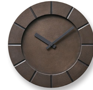
MK19-05 BK ブラック 4515030076414