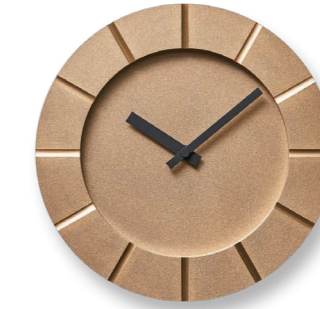
MK19-05 BZ ブロンズ 4515030076407