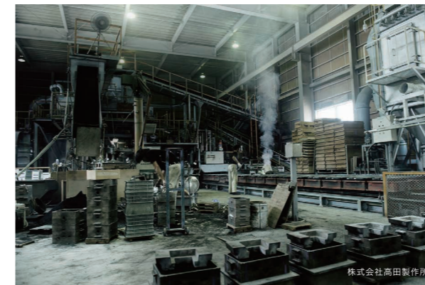
株式会社高田製作所

HALO is a wall clock that makes us warm as it seems to illuminate our daily life. Takaoka doki (Takaoka copperware) features the casting technology used to emphasize the clock's solid feel and the precise finishing of the surface.