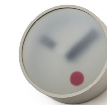
KM22-01 GY コンクリート 4515030100744

KM22-01 φ130×d55mm 295g アルミニウム、PP (ポリプロピレン)、ガラス スリーブセコンド ¥11,000 (本体価格¥10,000)