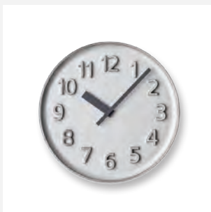
KK15-08 AL アルミニウム 4515030075288

The design uses numbers only, without adding other decorations, in order to highlight the beauty of the materials. This makes it look like it was originally part of the surrounding architecture from the beginning. (Founder also means a worker who makes metal castings).